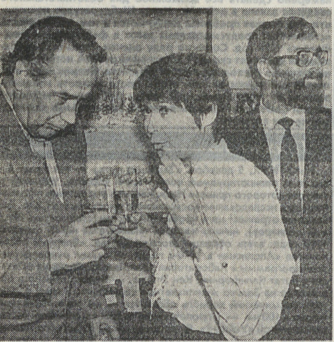
Пятилетний юбилей отметило объединение детских и подростковых клубов Кировского района «Социум». Именно этому событию был посвящен праздник, прошедший 1 декабря в Доме актера.