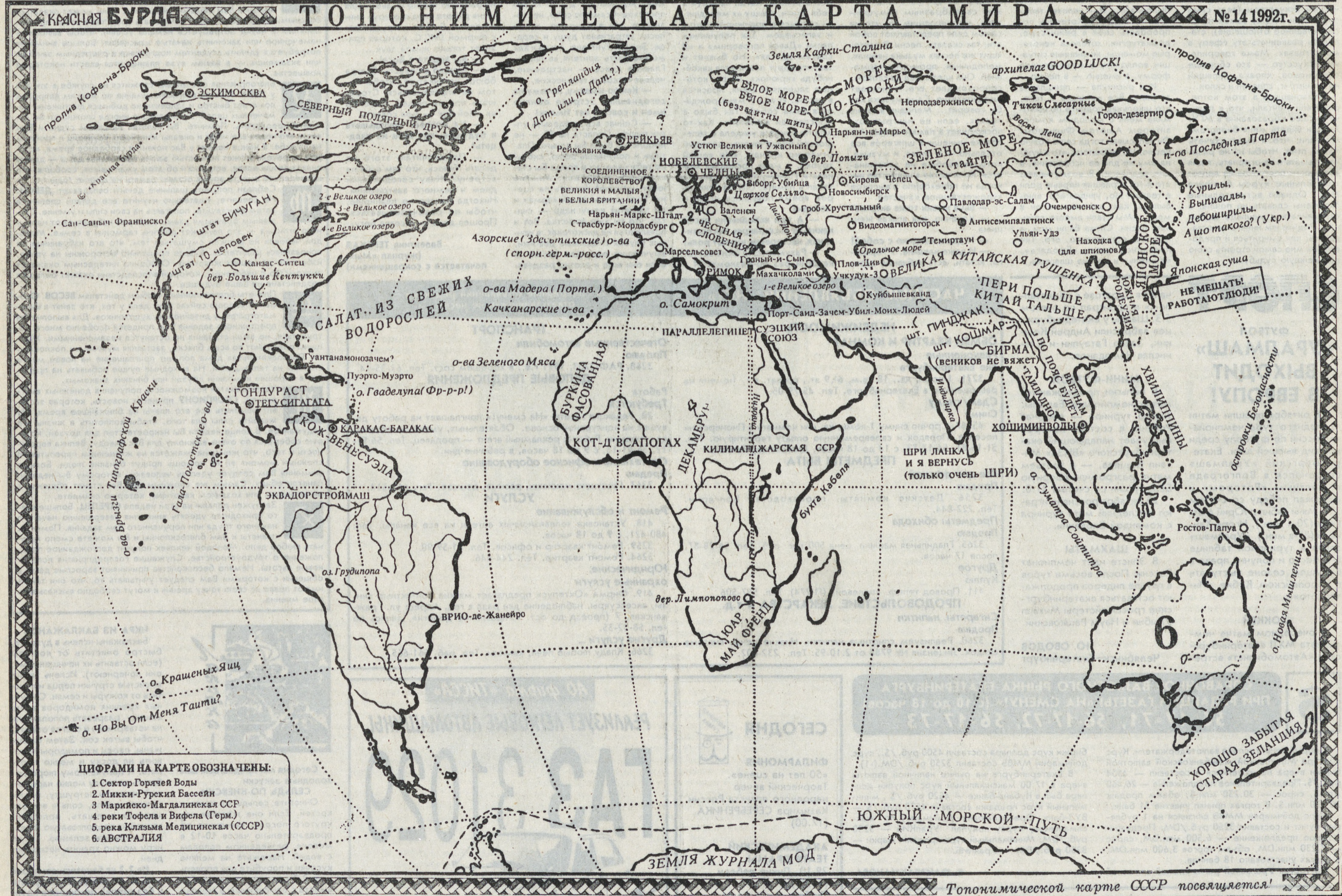
Топонимической карте СССР посвящается!

ПЕРВОУРАЛЬСКИЙ НОВОТРУБНЫЙ ЗАВОД ПРОДАСТ НОВУЮ ТРУБУ В НЕОГРАНИЧЕННОМ КОЛИЧЕСТВЕ И ДИАМЕТРЕ.