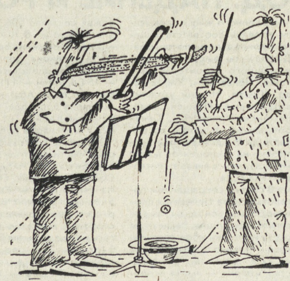
Рис. А. ПЯТКОВА