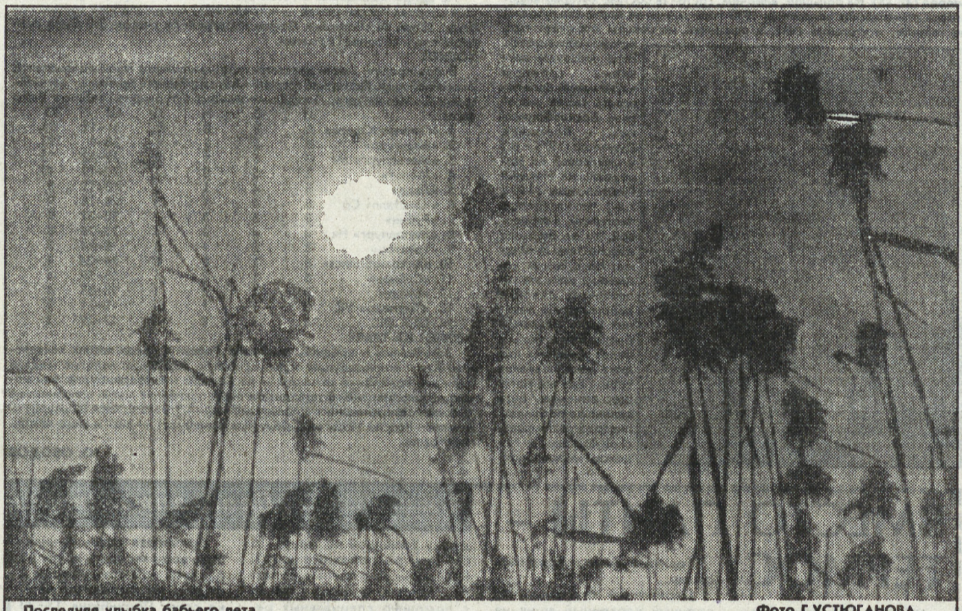
Последняя улыбка бабьего лета