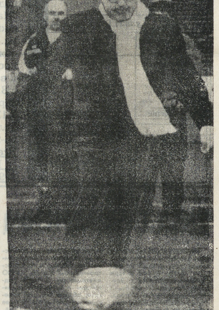
НА СНИМКЕ: канцлер Германии Гельмут Коль с мячом на «ты». А наши «канцлеры»!