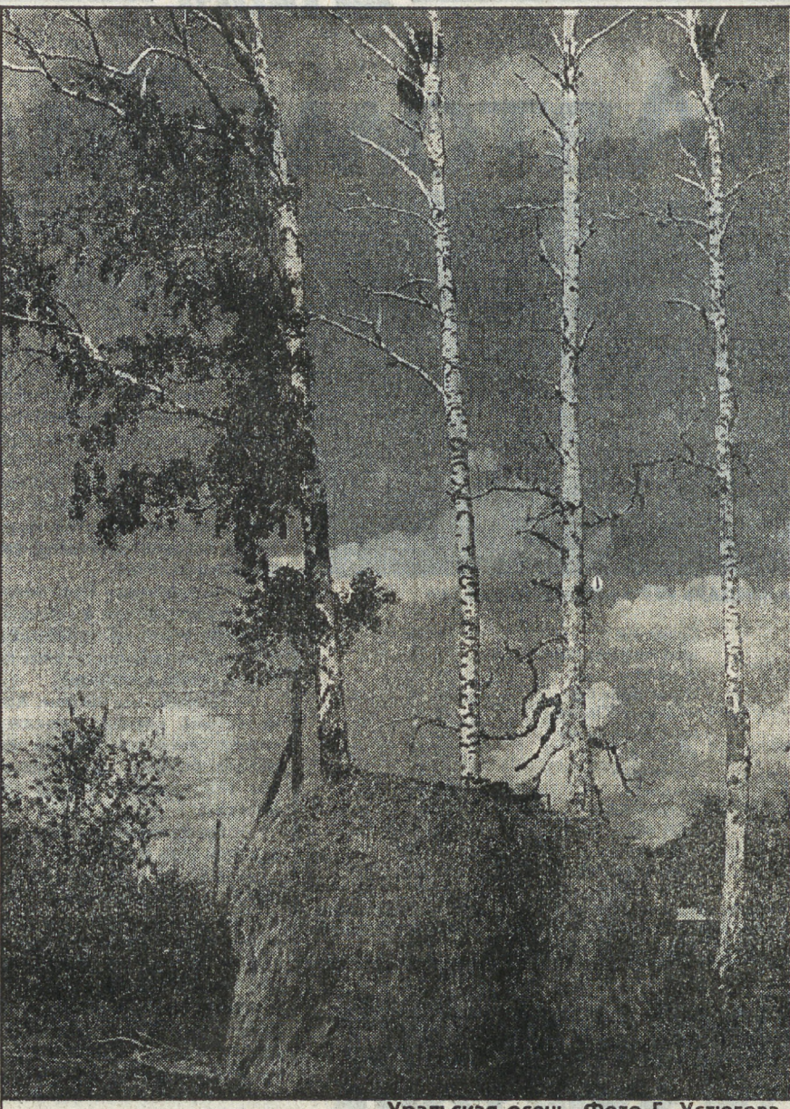
Уральская осень. Фото Г. Устюгова

теорий, заболевание связано с последствиями вдыхания продуктов сгорания нефти, которая была подожжена иракцами в Кувейте. Другая теория касается приема солдатами специальных медикаментов, которые должны были защитить их на случай применения противником отравляющих газов. В войне в Персидском заливе принимало участие 579 норвежских солдат. Большая часть из них входила в состав санитарного подразделения, расквартированного в Саудовской Аравии в 20 км от линии фронта. И. ПШЕНИЧНИКОВ ИТАР-ТАСС