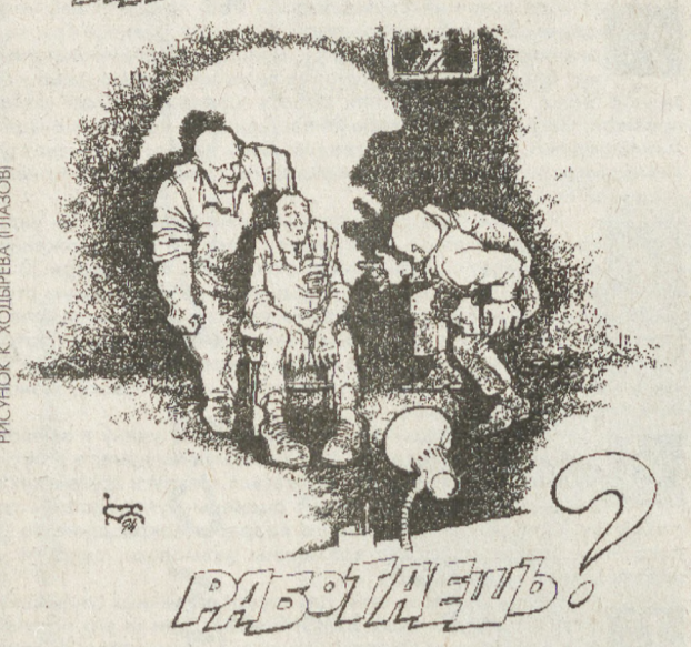
РИСУНОК К. УОЛФЕРА (ПРАЗОВ)