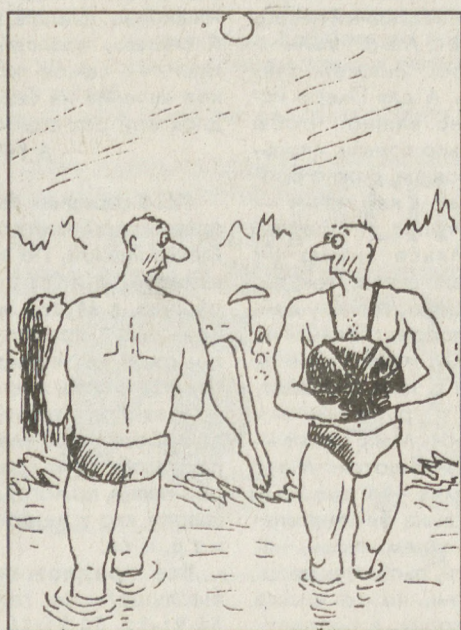
Рис. В. БОГОРАДА