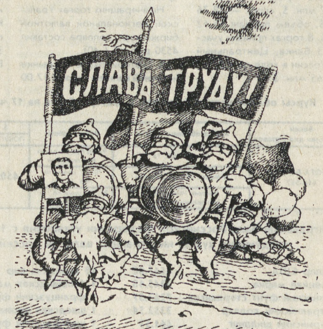
РИСУНОК С. КУЛЬМЕТШЕНОВА (АКМОЛА)