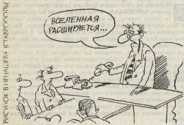
РИСУНОК В. И. НАУФИЛОВА (СТАВРОПОЛЬ)