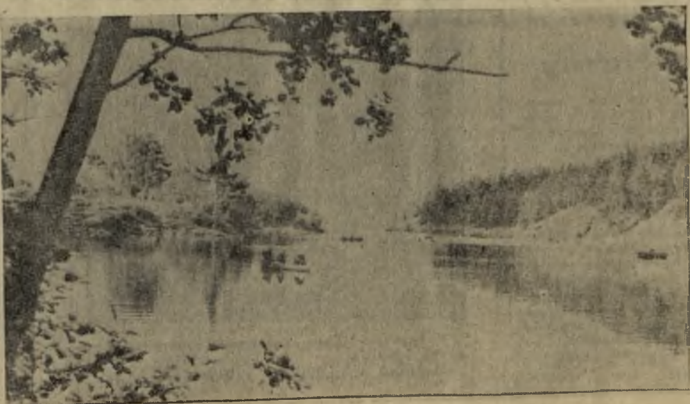
В устье реки Быстрой.