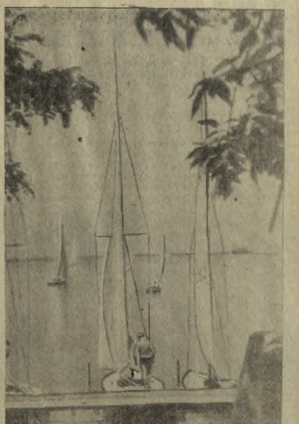
У причалов Селастопольского городского яхт-клуба в шталь.

Адрес типографии: город Реж, ул. Красноармейская, 22. Телефон — 1-103. Газета выходит три раза в неделю: по вторникам, четвергам, субботам.