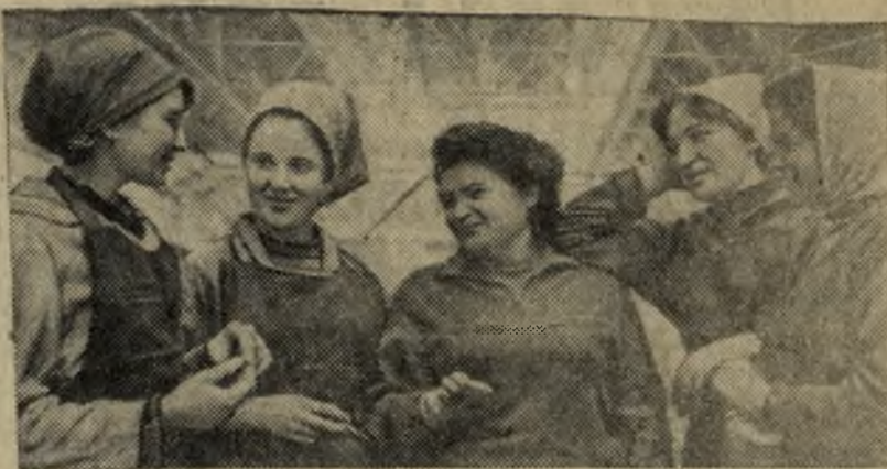
Свердловская область. Флагман химического машиностроения — Уралхиммашзавод известен не только как крупное предприятие, но и как инициатор ряда ценных начинаний. Пять лет назад здесь составили план НОТ. С тех пор движение за научную организацию труда распространилось по всей стране.