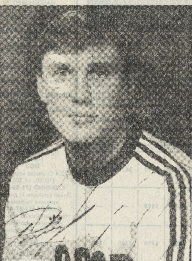
«Спартак». — Сейчас «Спартак» значительно сильнее «Уралмаша», и у вашей команды в этой игре шансов просто не было. — Что-то в «Уралмаше» вам поправилось! — Этот матч «Уралмаш» провёл, не показывая свои плюсы. Может быть, он по-