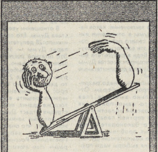
Рис. В. БОГОРАДА