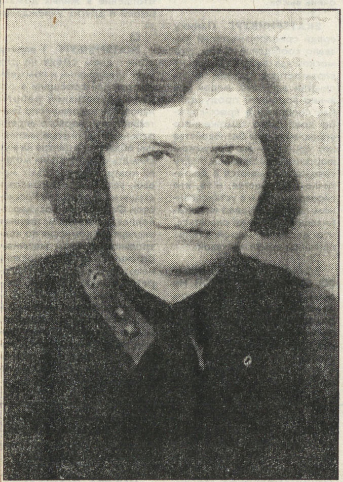
1941 г. Дивизия любой ценой должна отбить занятый немцами город Калинин. Окопавшись, мы ставим брезентовые палатки для приема раненых в населенном пункте Шебаршино, где уцелел только один домик, остальные сожжены. Санитары принесли еще дымящиеся головки от со-

всего нужно было спасать раненых от замерзания и обморожений. Каждому, кроме тех, у кого ранение было в голову, давали глоток чистого спирта. Затем приступали к обработке ран. Поражает терпение и выносливость наших бойцов. Страшный мороз, большая потеря крови, боль, мокрые бинты — от всего этого, казалось бы, человек должен потерять всякую выдержку, а они все выносили, ничего не требовали. Ждали своей очереди, лежа на полу, на носилках или сидя на корточках в тамбуре перевязочной, безропотно перенося холод, боль и все неудобства.