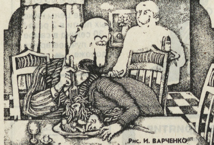
Рис. И. ВАРЧЕНКО

— Здравствуй, ребята! Поздравляю вас с переходом в третью, выпускной класс. Сегодня у вас первый урок по новой науке — географии. Начнем с рассказа о нашей родной Московии. Вы уже большие, и вам пора узнать ее географическое положение. Положение ее, не стану скрывать, именно такое — географическое. У нее нет выхода к морям, поэтому некоторые считают, что у нее нет выхода. Но не все так плохо. От Балтийского моря мы отделены дружелюбным государством Петербург имени Ленина, через его порты мы экспортируем маринованные грибы, земляничное варенье, жареных карасей и другую продукцию наших передовых предприятий. Правда, к Северному морю нас не пускает Мурманск, с которой мы в споре из-за взаимных претензий на земли Вологодского княжества. Зато к югу от нас лежит могущественная Чехословацкая Джамахирия, пропускающая нас к своим черноморским портам за небольшой ясяк и при условии, что проводники грузов принимают магометанство. На востоке наша страна граничит с СССР — Союзом Советских Сибирических Республик. С СССР нас связывают добрососедские отношения. Как вы знаете, еще в прошлом году к нам с официальным визитом выехал на оленьих генеральных шаман Якутской коммуно-мистической республики, его прибытие ожидается в ближайшие зимы. В свою очередь, делегация нашего Совета народных коммерсантов выехала с дружественным визитом в Уральскую