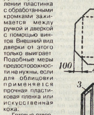
Рис. 4. Основные элементы дверки верхнего отделения: 1 — облицовочное полотно с лицевой стороны; 2 — облицовочное полотно с тыльной стороны; 3 — рамка; 4 — облицовочная заготовка; 5 — дверки