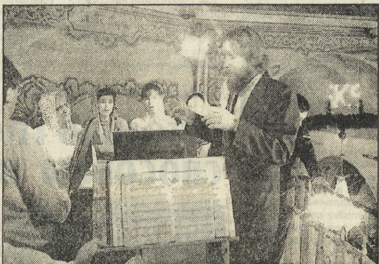
в Ивановской церкви Екатеринбурга.