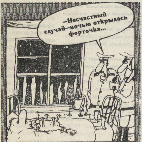
Рис В. ШИЛОВА