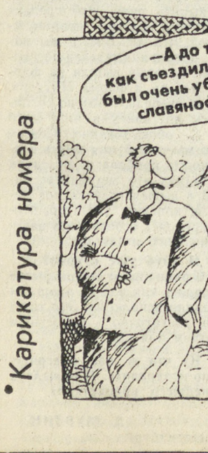
Рис. Вячеслав ШИЛОВА.

На Уральской региональной валютной бирже и доллара и лотычка «подросли» на 5 рублевых пунктов, курсы составили 2317 руб./долл., и 1501 руб./ДМ. В Екатеринбурге на рынке наличной валюты максимальный курс покупки доллара установили вчера «Кубань-банк» и «Золото-Платина банк» — 1330 руб./долл., минимальный курс продажи доллара был в «Коммерческом индустриальном банке» — 1340 руб./долл. Дойдя до максимальной цены покупки «Золото-Платина банк» и «Гран-банк» — 1510 руб./ДМ, по минимальной цене продавал СКБ-банк — 1515 руб./ДМ. Герман КОРОБЕЙНИКОВ.