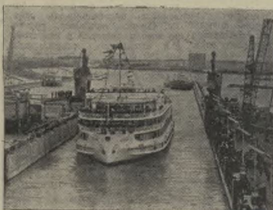
Саратовская область. Флагман Волжского флота дизель-электроход «Ленин» открыл движение судов через шлюзы Саратовской ГЭС.

Она и Тамара, взявшись за руки, бредут меж высоких сосен по прозрачной тишине. Ноги их шлепают по муравьиным тропам, покрытым колючими сосновыми иголками.