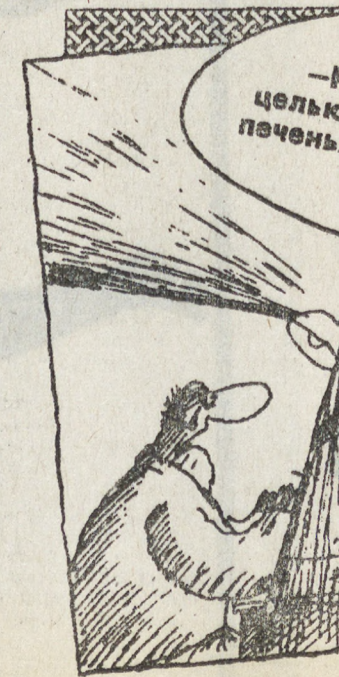
Юрий КОБЕЛЬНИКО «Известия» Париж Рис Вячеслава Шилова

В последние годы действие романа Жерара де Вилье все чаще разворачивается в начале в Советском Союзе, а потом в России — «Незнакомец из Ленинграда», «Миссия в Москву», «Красный раствор», «КГБ против КГБ», «Осторожно, plutonium» и, наконец, одна из последних книг — «Золото Москвы».