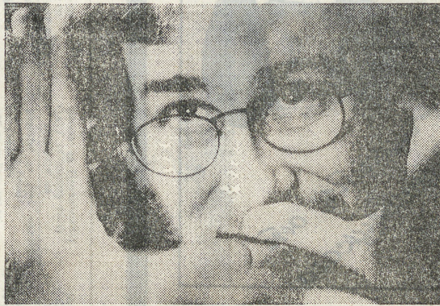
Семь призов Американской киноакадемии, семь «Оскаров», данных фильму Стивена Спилберга «Список Шиндлера», составляя теперь своеобразный «Список Спилберга», ведь его картина первой приблизилась к рекорду, поставленному еще в 1961 году «Вестсайдской историей» Подробности и интервью с режиссером читайте в выпуске «Экрана», посвященном очередному Дню кино, в нашей газете.