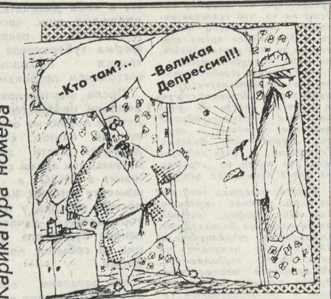
Рис. Вячеслав ШИЛОВА.