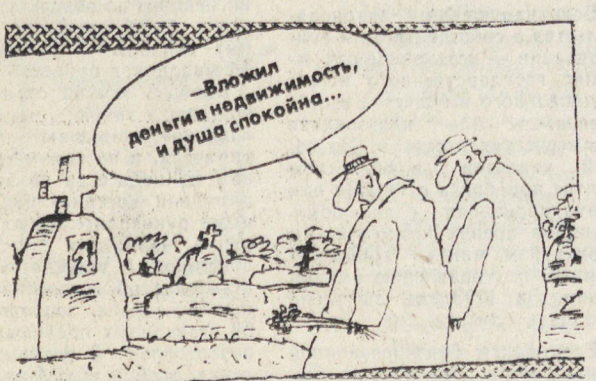
Рис. Вячеслава ШИЛОВА.