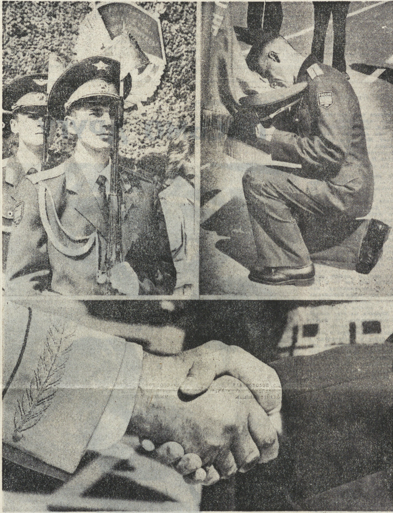
Цветы, оставленные курсантами на Плацке, — прощальный привет городу, который стал им родным на целых четыре года. А может, и на всю жизнь.

А пятеро ребят направляются на службу в вооруженные силы Украины, Казахстана, Беларуси и Таджикистана, согласно договору стран СНГ «О подготовке военных кадров». В следующем году таких ребят, по-видимому, будет больше. Многие из нынешних выпускников ЕВАКУ приехали учиться в Екатеринбург из других городов и республик. И свои первые офицерские погоны они одели именно в Екатеринбурге.