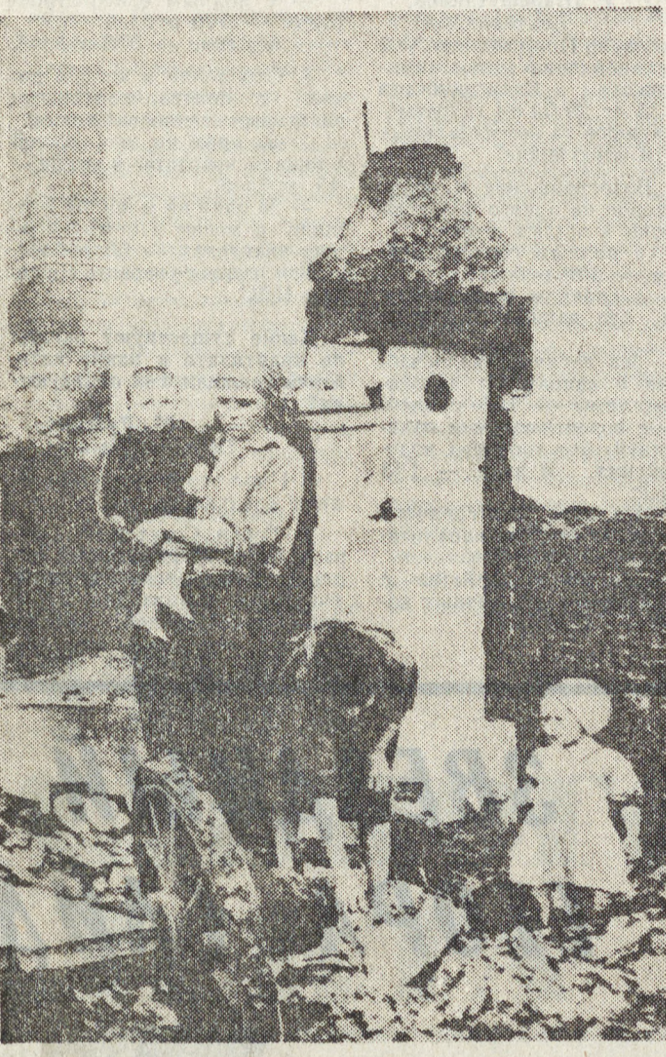
...где еще пытались сделать вид, что соблюдают положение Женевской конвенции об отношении к воен-