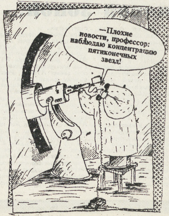
Рисунки В. ШИЛОВА.

Минувшие выходные не принесли душевного спокойствия садоводам. Дачные домики горели по всей области. Особенно активно в Каменске-Уральском и Нижнем Тагиле. Основная причина — неисправность печного отопления. В Екатеринбурге в доме 19 «а» на улице Искровцев в собственном спальном мешке погиб мужчина. Он курил, находясь в восточном направлении для этого места. От случайной искры мешок начал тлеть и человек погиб, отравившись продуктами горения. В многоквартирном Серове очередное ЧП. В воскресенье произошло главный водовод. Весь город остался без воды. Пожарные пришли на помощь: они хлорировали воду в своих цистернах и развозили ее по детским садам, больницам, оздоровительным лагерям. Пресс-группа пожарной охраны.