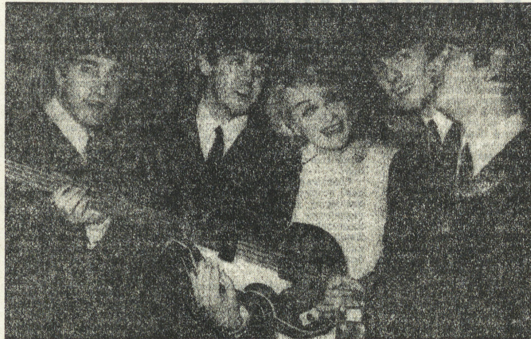
КРЕСТИТОНЖ — ДЕЛО МОЖНОЕ