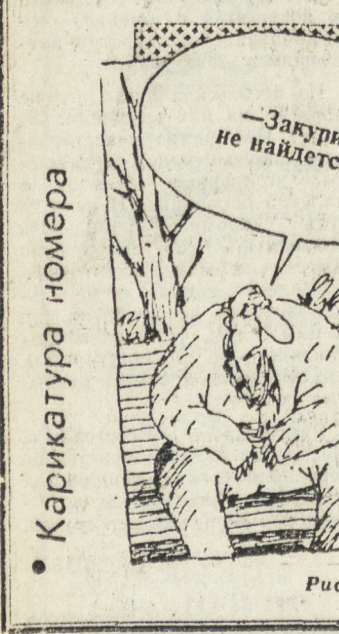
Карикатура номера Рис Вячеслава ШИЛОВА.

1—2 июня по области ожидается переменная облачность, без осадков. Ветер юго-восточный. 2—7 метров в секунду. Температура воздуха: 1 июня ночью +1-6, на востоке области на поверхности почвы слабые заморозки, днем +13+18, 2 июня ночью +4+9, днем +20+25.