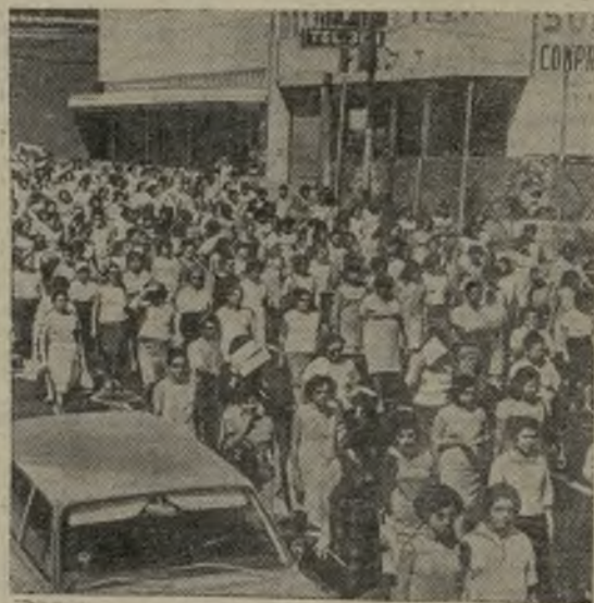
В столице Сальвадора состоялась многотысячная демонстрация учителей и студентов.

ранены группой движения Сопротивления в концентрационном лагере. Извлеченные из тайников в стенах и из могил лагеря смерти, они увидели свет в 1945 году.