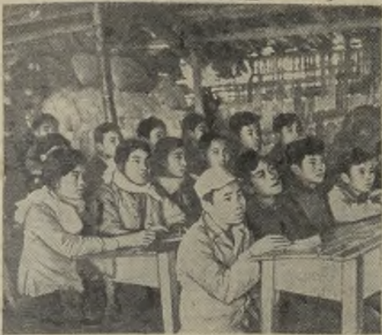
Демократическая Республика Вьетнам. Четырехмиллионная армия учащихся успешно овладевает знаниями.

На снимке: идет урок в десятилетней школе Донгсона, провинция Тханьхоа. Классной комнатой является бамбуковый коттедж, построенный на месте разрушенного американцами здания.