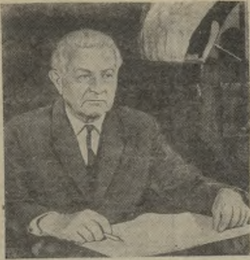
Президент Чехословацкой Социалистической Республики товарищ Людвик Свобода.