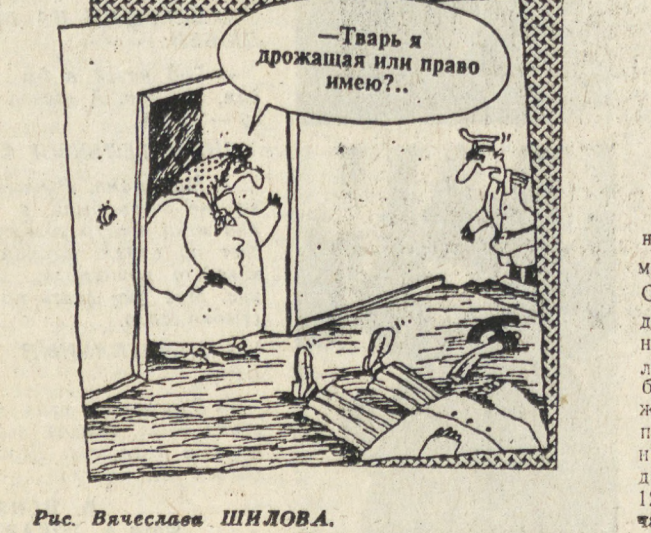
Рис. Вячеслав ШИЛОВА.