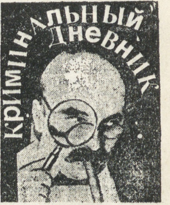
За минувшие сутки по области зарегистрировано 254 преступления, показатель прошлого года 265, по 117 преступлений раскрыто

Что представляет из себя российская культура на сегодняшний день и какова ее роль, ее место в жизни общества, каков ее потенциал, ее созидательная сила?