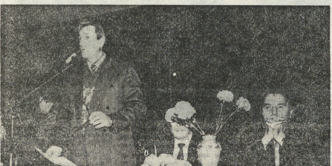
Беседовала Злата ТОРГУШИНА.