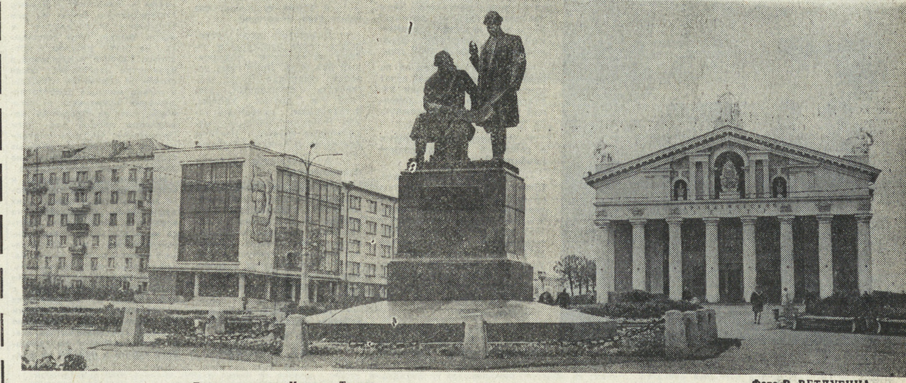
Главная площадь Нижнего Тагила.