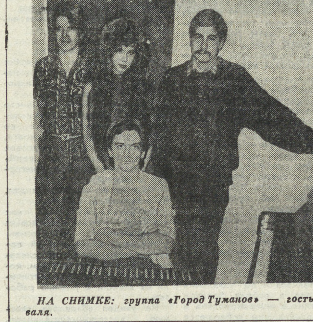
НА СНИМКАХ: группа «Город Туманов» — гости фестиваля.