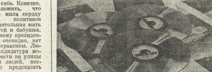
Лазерные диски? На подходе!

Быть губернатором лучше, чем президентом, — возмущают Акино, показывая, что за пост главы государства не держится.