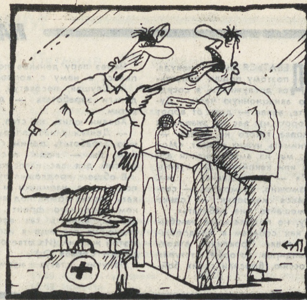
Рис. Аркадия ПЯТКОВА