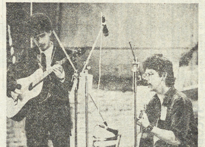
НА СНИМКЕ: группа «Бани».