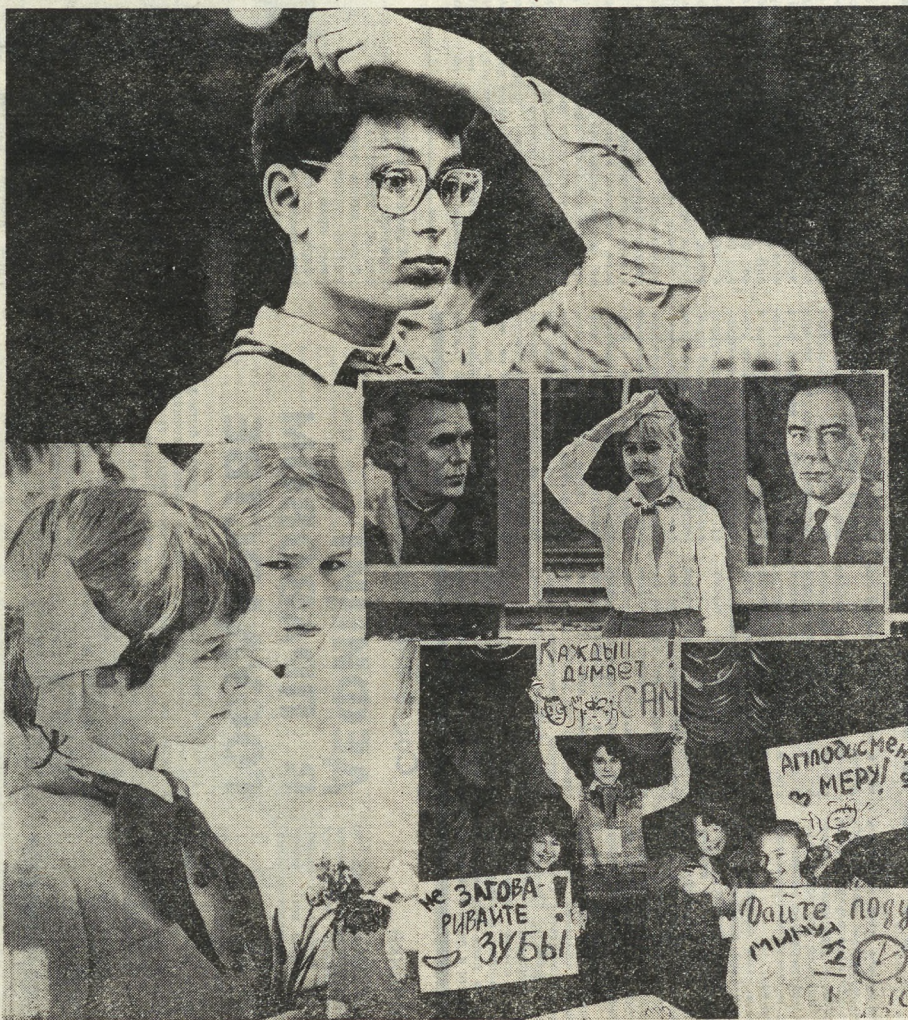
Фотомонтаж Р. Канникова и В. Якубова.

студентка журфака УрГУ, бывшая пионерка.