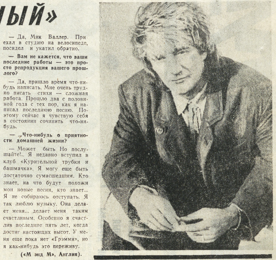
(«М энд М», Англия).