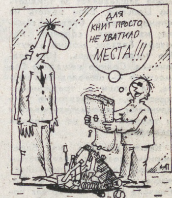
Рис. А. ПЯТКОВА.