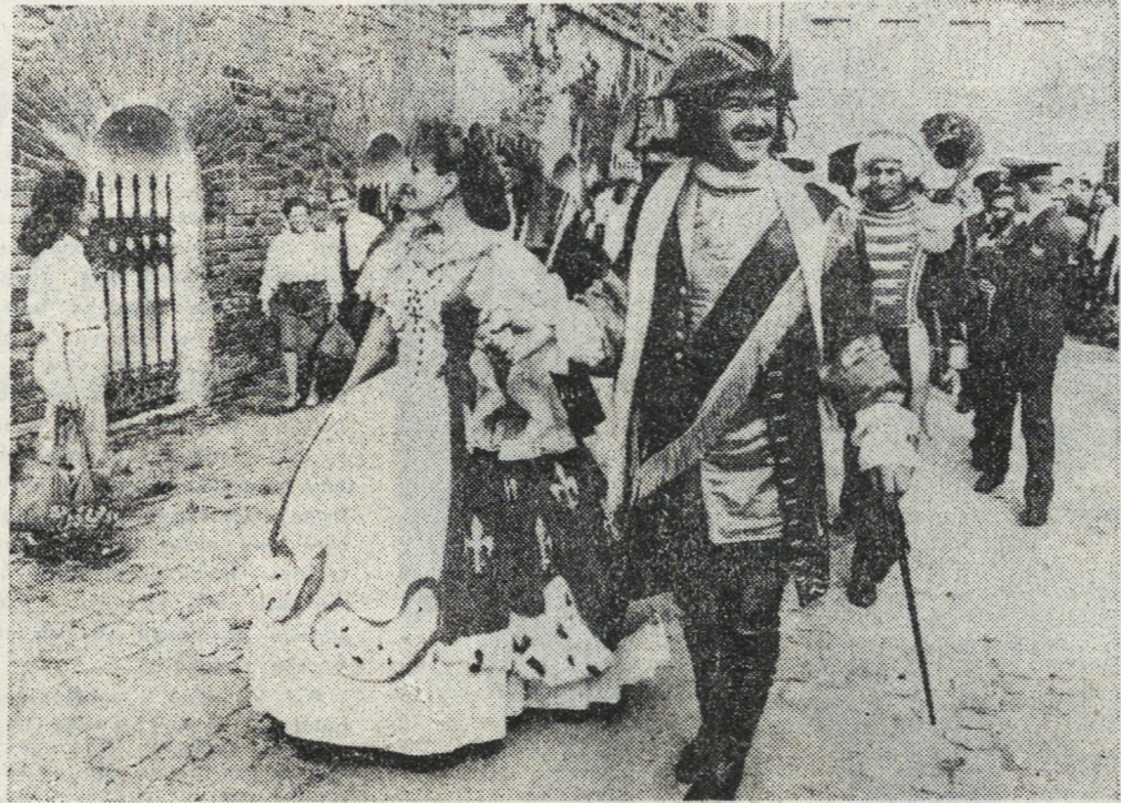
Продолжение рассказа о праздновании Дня города читайте на 2-й странице.