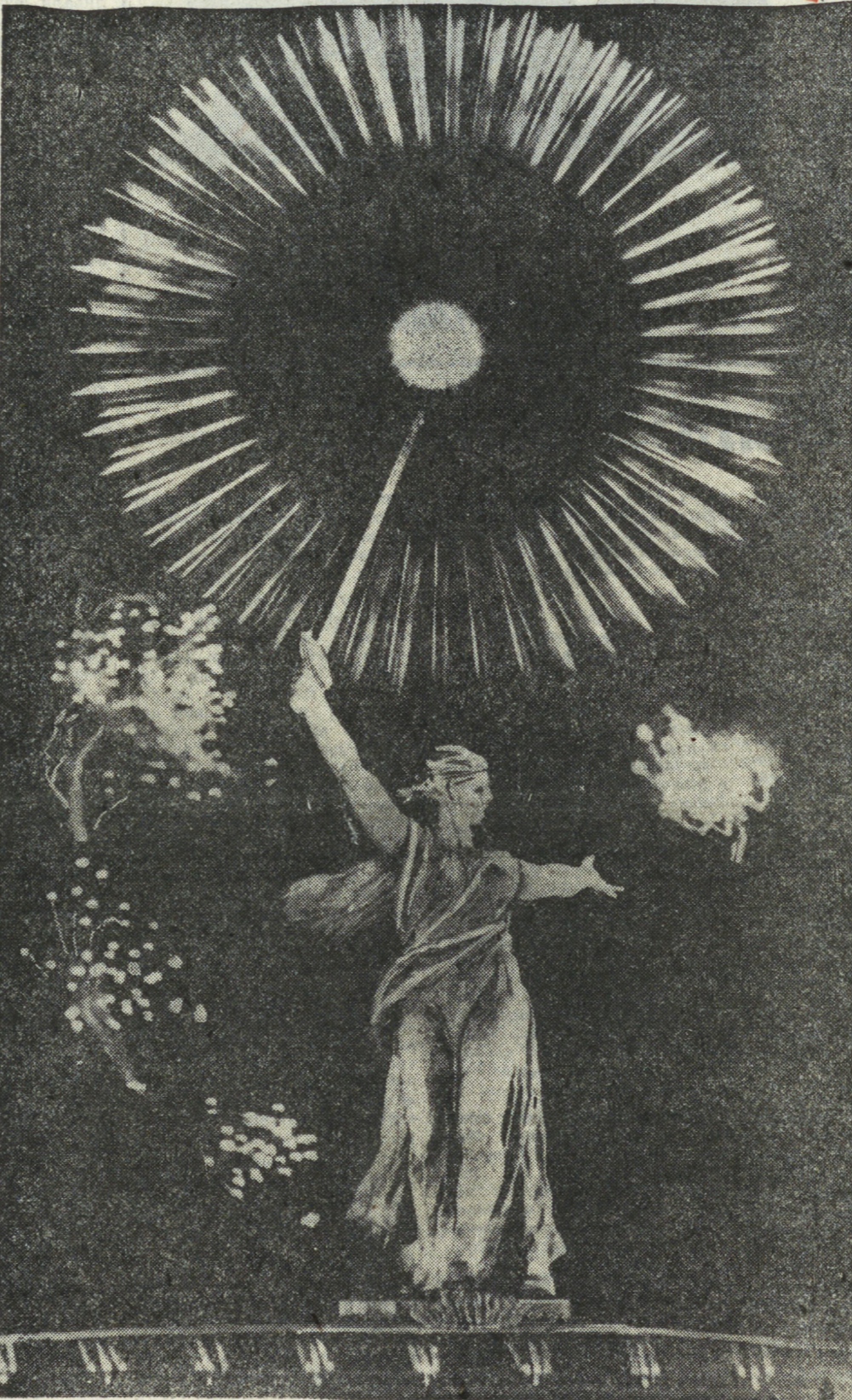
Фотомонтаж Р. КАПТИКОВА.