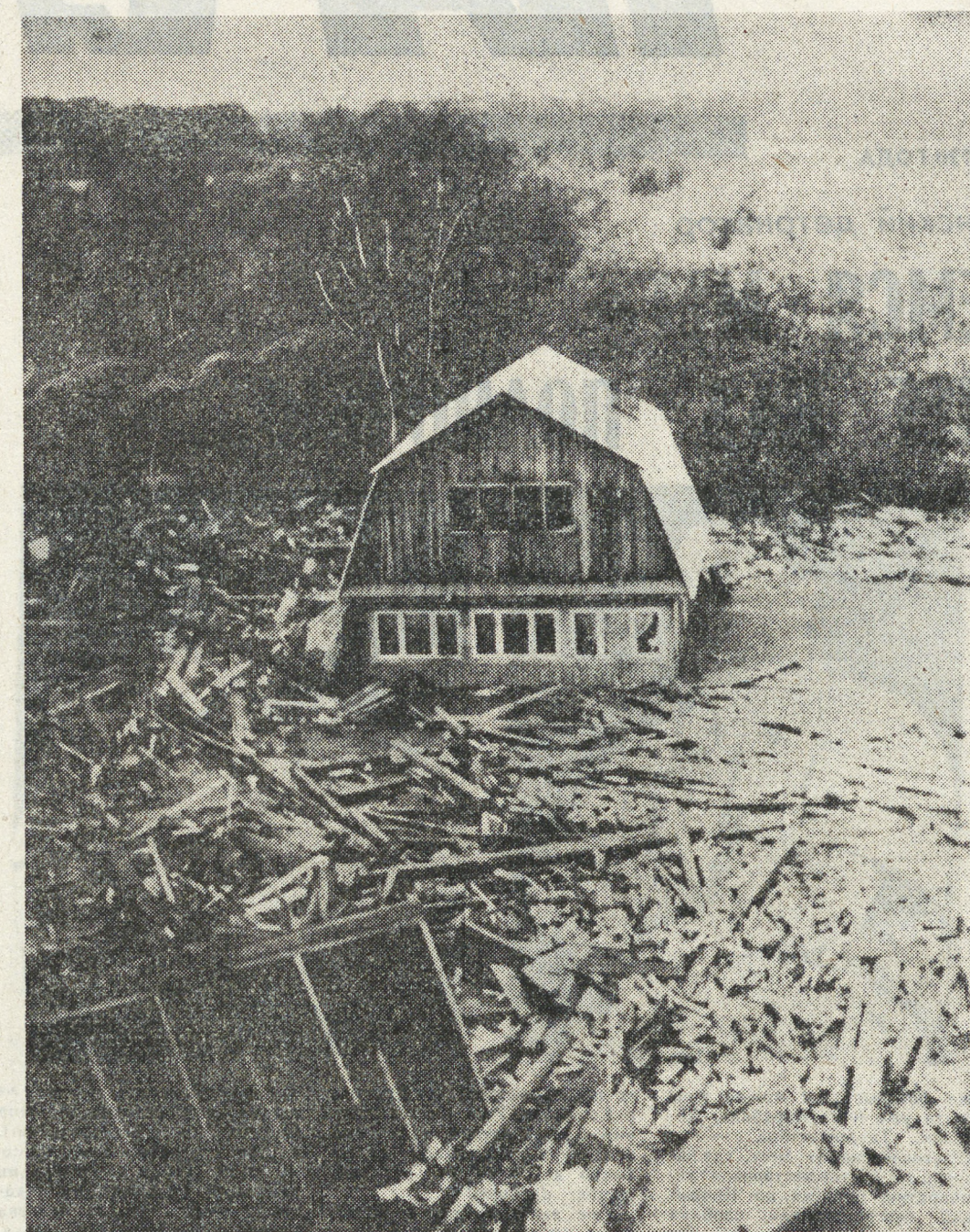
Водяной паводок в Серове.

на обоях чуть ниже потолка. По дороге в город двинулись «Запорожцы» и «Москвичи» с наваленными внутри, сверху и даже сбоку тюками, шли женщины с тележками, в грузовики складывались казенные одеяла, свернутые в узлы. Кто-то забрасывал на крыши домашнюю утварь и со-