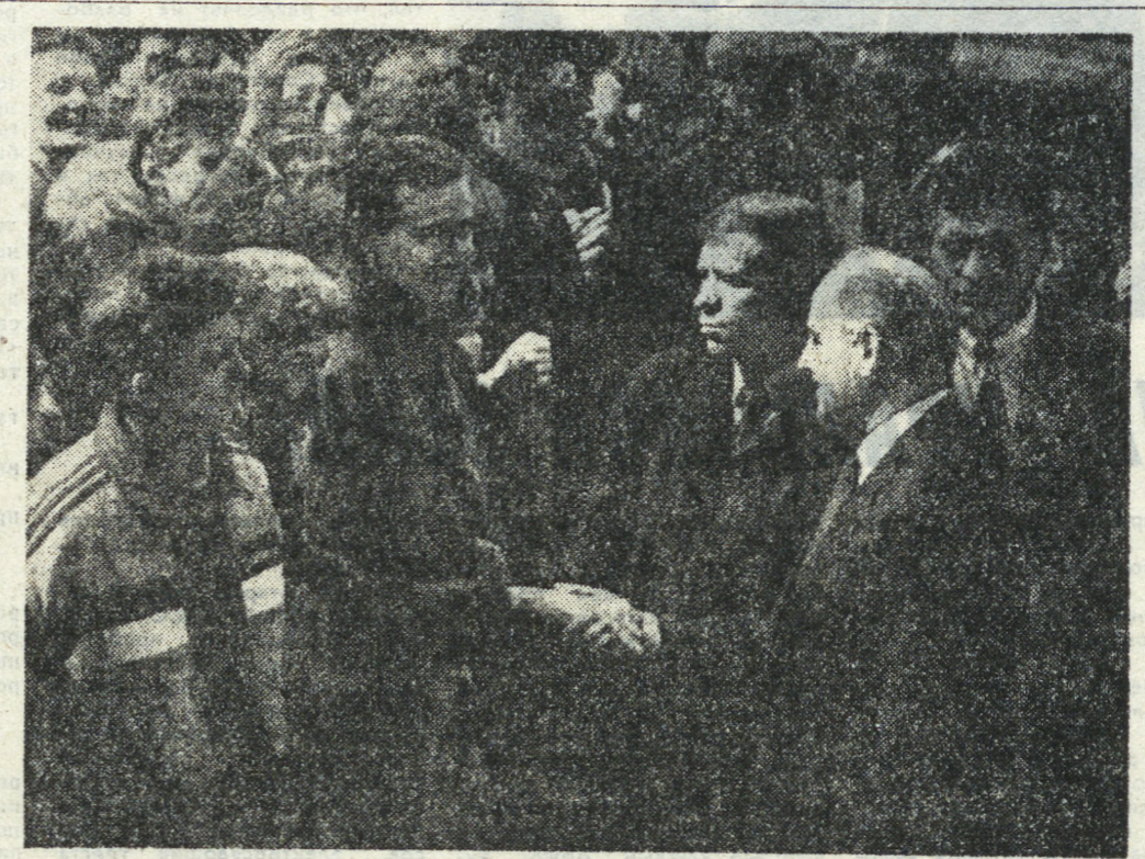
Во время поездки по Свердловской области и Президентом СССР М. С. Горбачевым о социально-экономических проблемах страны. НА СНИМКЕ: одна из таких встреч.

М. С. Горбачев ответил и на многие другие вопросы представителей из разных областей. Встреча продолжалась несколько часов. (ТАСС).