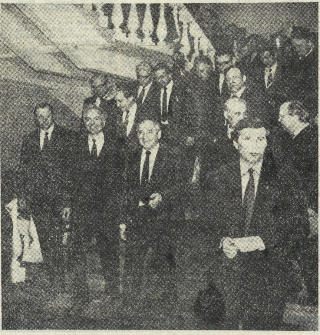
И. А. СНИГМАХ: (вверху) Президент СССР, Генеральный секретарь ЦК КПСС М. С. Горбачев возлагает венки к памятнику В. И. Ленину; во время посещения М. С. Горбачевым Уральского отделения Академии наук СССР.