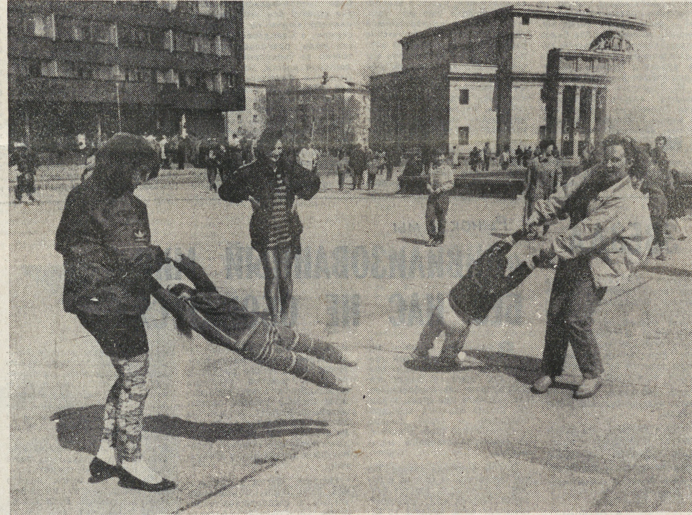
Фоторепортаж из Екатеринбурга вел Андрей ПОРУБОВ.