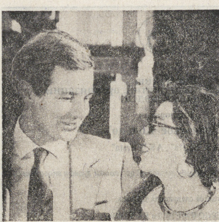
Принц Райнер, правитель Монако, в конце года намеревался активнее привлечь к управлению княжеством Стефано и его жену принцессу Каролайн, которая активно высказывалась за расширение борьбы с мафией.

Члены его семьи и близкие друзья никогда не верили в его случайную смерть (яхта перевернулась на большой скорости и получивший в этот момент удар по голове чем-то из оснащения судна Стефано захлебнулся), потому что он был опытным яхтсменом с многолетним стажем.