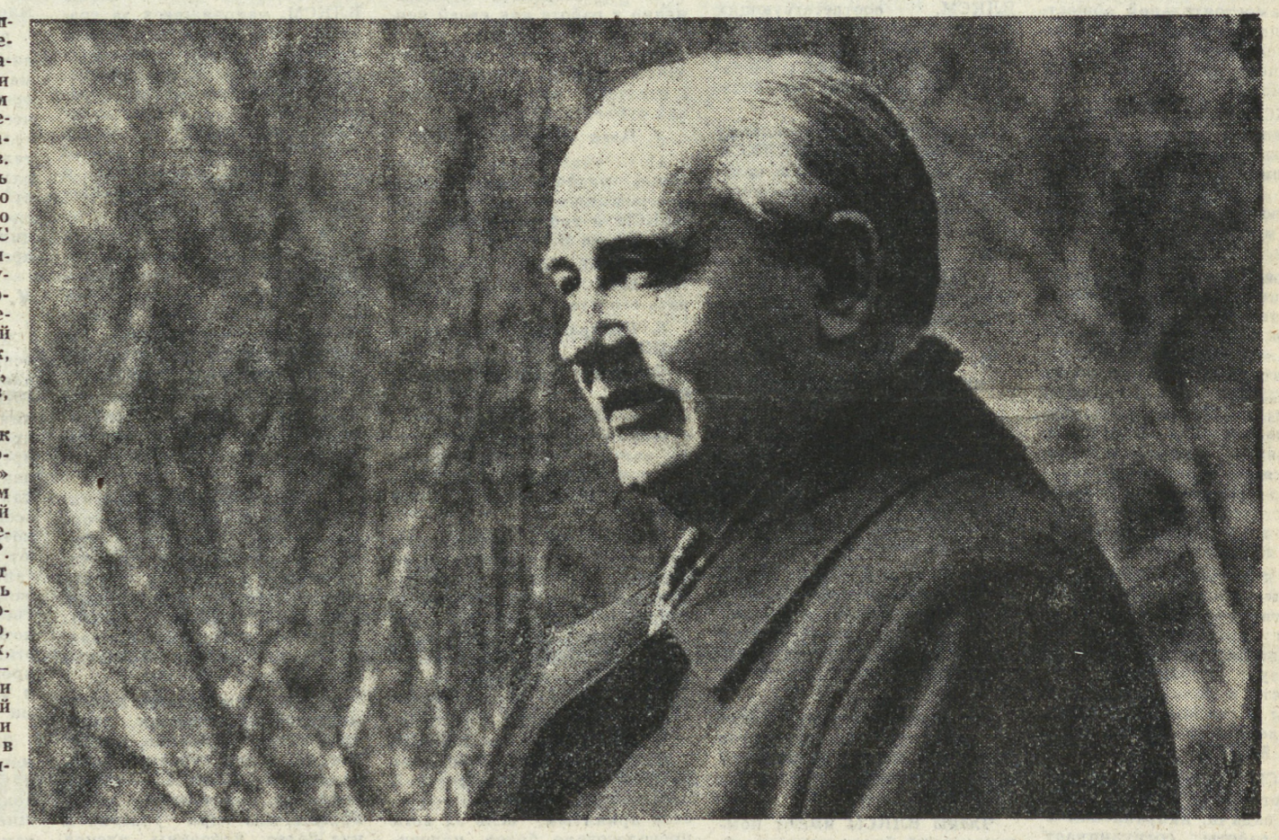
С. МАТЮХИН.

И вот Свердловск, как принято было раньше говорить, «удостоился чести» стать первым нестолычным городом страны, который принял М. Горбачева в качестве Президента СССР.