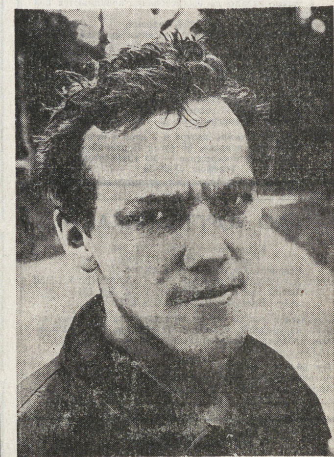
Редакция газеты «На смену!» и ее отдел спорта в пятый раз (первый победил!) подвели итоги конкурсно-опроса на звание лучшего хоккеиста Свердловской области. Вот, как и в прошлые годы, на предстоящем почете «НС» только мастера Екатеринбургского «Автобиста». Но — второй год подряд (удивительное дело) — один и те же...