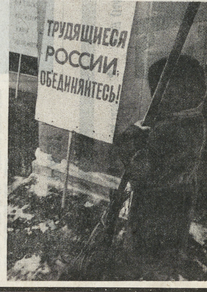
Протестировал С. МАТЮХИН. На фото ИТАР — ТАСС: металл — оружие пролетариата...