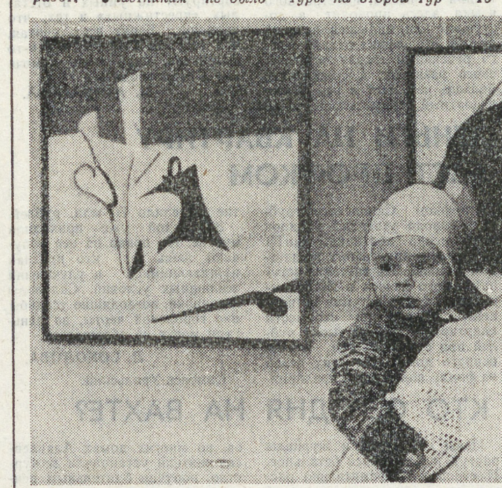
Открытие выставки стало первым туром конкурса, на котором были отобраны кандидатуры на второй тур — 10 человек, из числа которых экспертная комиссия выберет двух. Победители получат путевки в княжество Лихтенштейн — экзотическое альпийское государство в верховьях Рейна, дивный край гор и лугов — и смогут лично познакомиться с творчеством художников Западной Европы и побывать в Швейцарии и Австрии.

В конце прошлой недели состоялось открытие выставки-конкурса молодых художников — в Музее изобразительных искусств по адресу: Вайнера, 11. Выставка организована силами акционерной компании «Эстер».