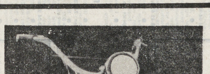
Каждый устроивается в жизни, как может. Все зависит от себя. А с клубными делами...