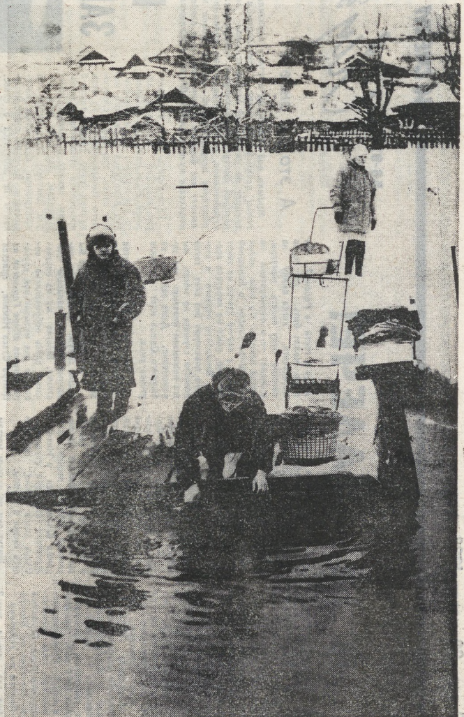
Мужское «полоскание» в начале весны