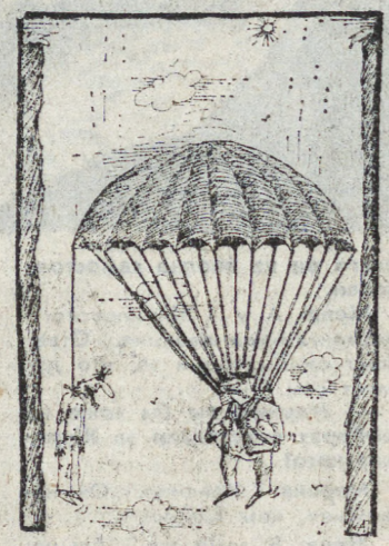
Рис. А. ПЯТКОВА.