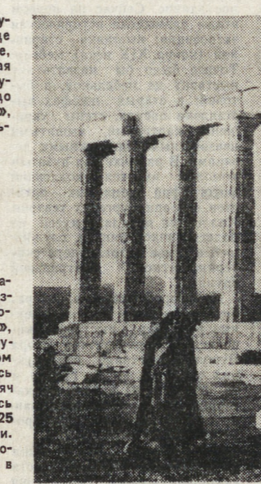
ТАСС И ИАН СООБЩАЮТ

В 1989 году самолет-разведчик SR-71 «Блэкберн», летавший в три раза быстрее звука, снял с вооружения американских ВВС, ошибочно расценив, что его вполне могут заменить