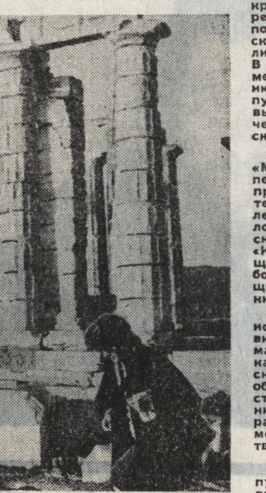
ТАСС И ИАН СООБЩАЮТ

SR-71. Позже «летающие треугольники» получили название «программа «Аврора»». По оценкам военных экспертов, этот самолет способен разогнаться до скорости, соответствующей числу М-7.