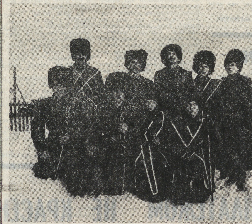
Казаки вновь, как и прежде, заявили о себе: они готовы защищать Отечество.